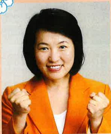
衆議院議員 あべ 俊子

「東京れんめい」20号 昨夏の総選挙で政権交代が行われ、国会の風景も大きく変わりました。一方で、私自身は衆議院議員として2期目を迎えさせていただき、党の国会対策副委員長、厚生労働委員を拝命し、日々、国政で汗を流しております。また、今年、看護職の労働環境の改善を第一の課題にかかっています。長時間労働、超過勤務、低賃金など多くの課題を