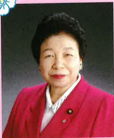
参議院議員 南野 知恵子

“夏の陣に焦点を” 「東京れんめい」20号 ご愛読の皆様にご支援賜り、感謝致しております。 寅年も、早や2月となり、必勝を願う。7月迄、5か月と残り少なくなりました。皆様方もジャンプ、ジャンプで、毎日何回もタカガイーと宣伝して下さっていると思います。今年寅年、雑念にトラわれず、トラぶるに巻き込まれず、ハードルあげてトラいし