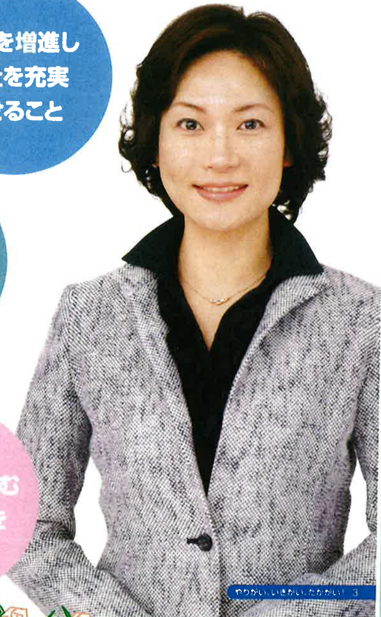
やりがい、いきがい、たかがい。 3