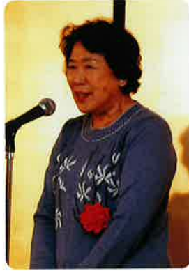
日本看護連盟 会長 清水嘉与子