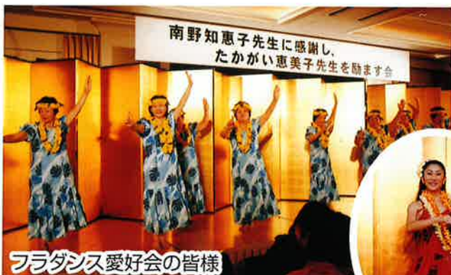
フラダンス愛好会の皆様