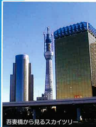
吾妻橋から見るスカイツリー