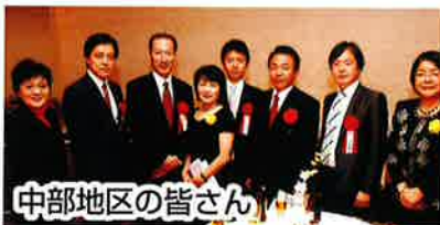
中部地区の皆さん