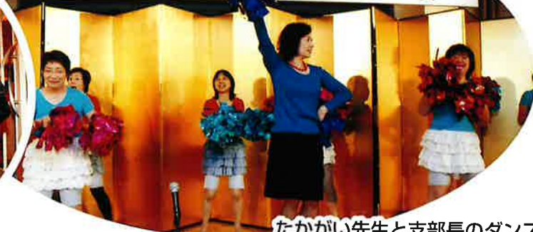
たかがい先生と支部長のダンス