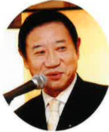
都議会議員 三宅しげき様 (東京都議会自由民主党 幹事長)