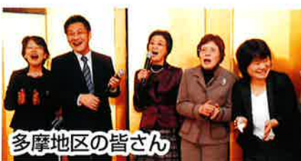
多摩地区の皆さん