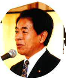
衆議院議員 下村博文様 (自由民主党東京都支部連合会会長代行)