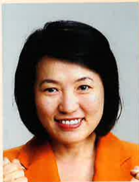
衆議院議員 あべ 俊子

東京都看護連盟の皆様、いつも温かいご支援を賜り心より感謝申し上げます。新しい年を迎え、本年もどうぞよろしくお願いいたします。