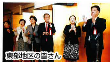
東部地区の皆さん