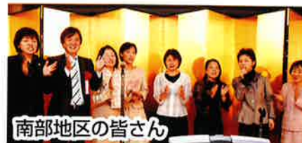
南部地区の皆さん