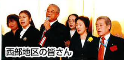
西部地区の皆さん